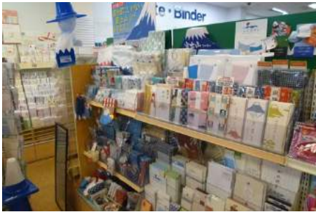
★ 漢文様の富士山シリーズ